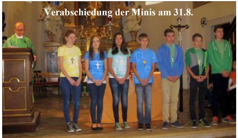
Verabschiedung der Minis am 31.8.