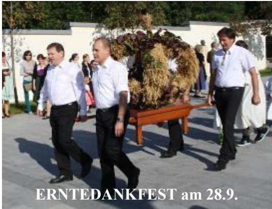
ERNTEDANKFEST am 28.9.